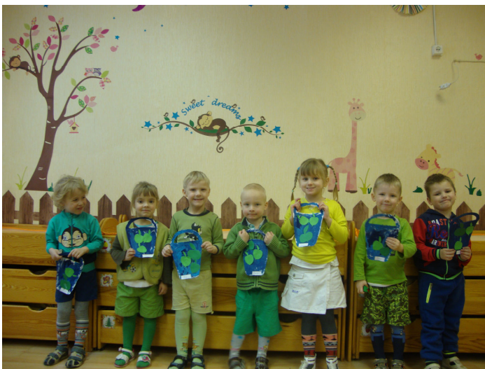
I.Dzenes teksts un foto