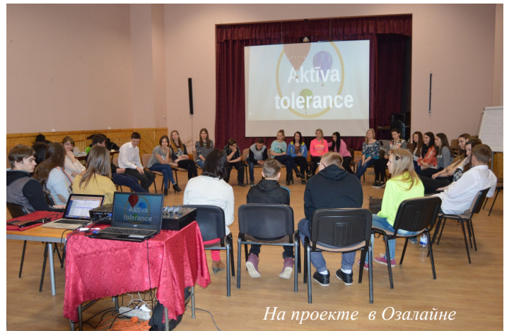
На проекте в Озолайне

Молодежный клуб благодарит Аудринское волостное управление за поддержку!