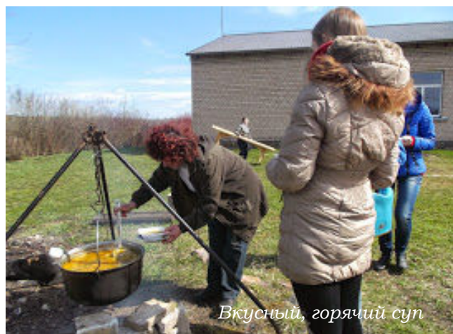
Вкусный, горячий суп