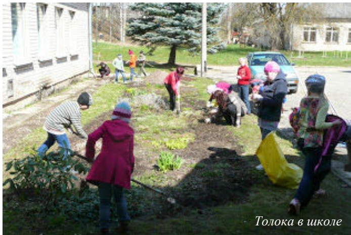
Толока в школе

В Аудринской основной школе участвовали 83 человека. Директор школы, учителя, школьники и технические работники убрали школьную территорию - грабили сухие листья, сжигали срезанные кусты, приводили в порядок школьный сад и собирали мусор. После толоки был общий обед у костра.