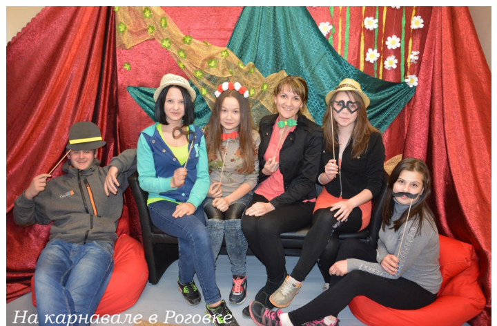
На карнавале в Роговке

Т. Сейле-Зундане, специалист по делам молодежи Аудринской волости (текст, фото) ; пер. с лат. в сокр. В. Виша