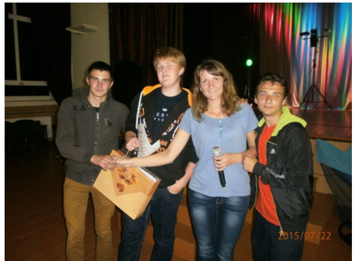
Audriņu komandas pārstāvji saņem apbalvojumu

5. Rēzeknes novada Jauniešu klubu salidojumā 1. vietu ieguva Audriņu jauniešu komanda, 2. vietu izcīnīja Feimaņu jaunieši un 3. vietu – Čornajas komanda.